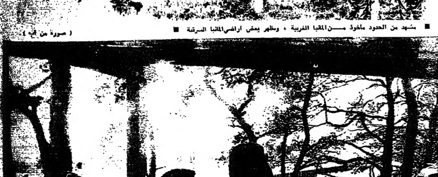
من موقع بين التشار قريب من الحدود ، بعض الجنود يرافقه حركت المانيا الشرقية على الحدود